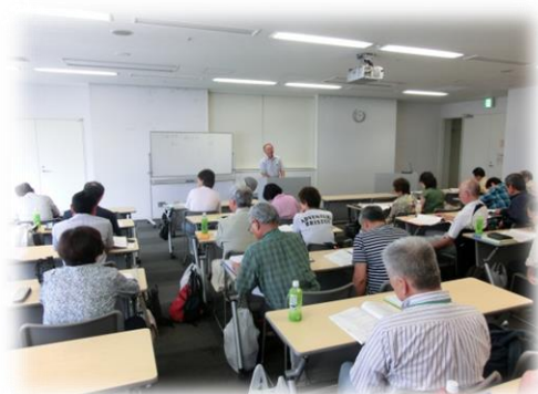
野菜の種類について、タマネギは根菜類？ 答えは葉菜類でした。