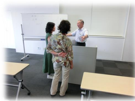
講義の合間には、沢山の質問が有りました。