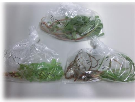
雑草防除では、カタバミ、ハマスゲ、スベリヒユの難防除が紹介されました。