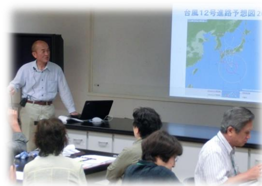
H23年9月の台風12号で、紀伊半島で記録的な豪雨となった事例を紹介。