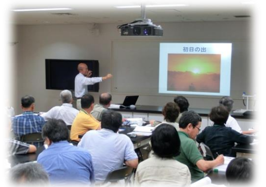
講師自身が撮られた写真で、千葉の天気の特徴が紹介された。