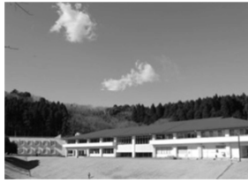
君津亀山少年自然の家