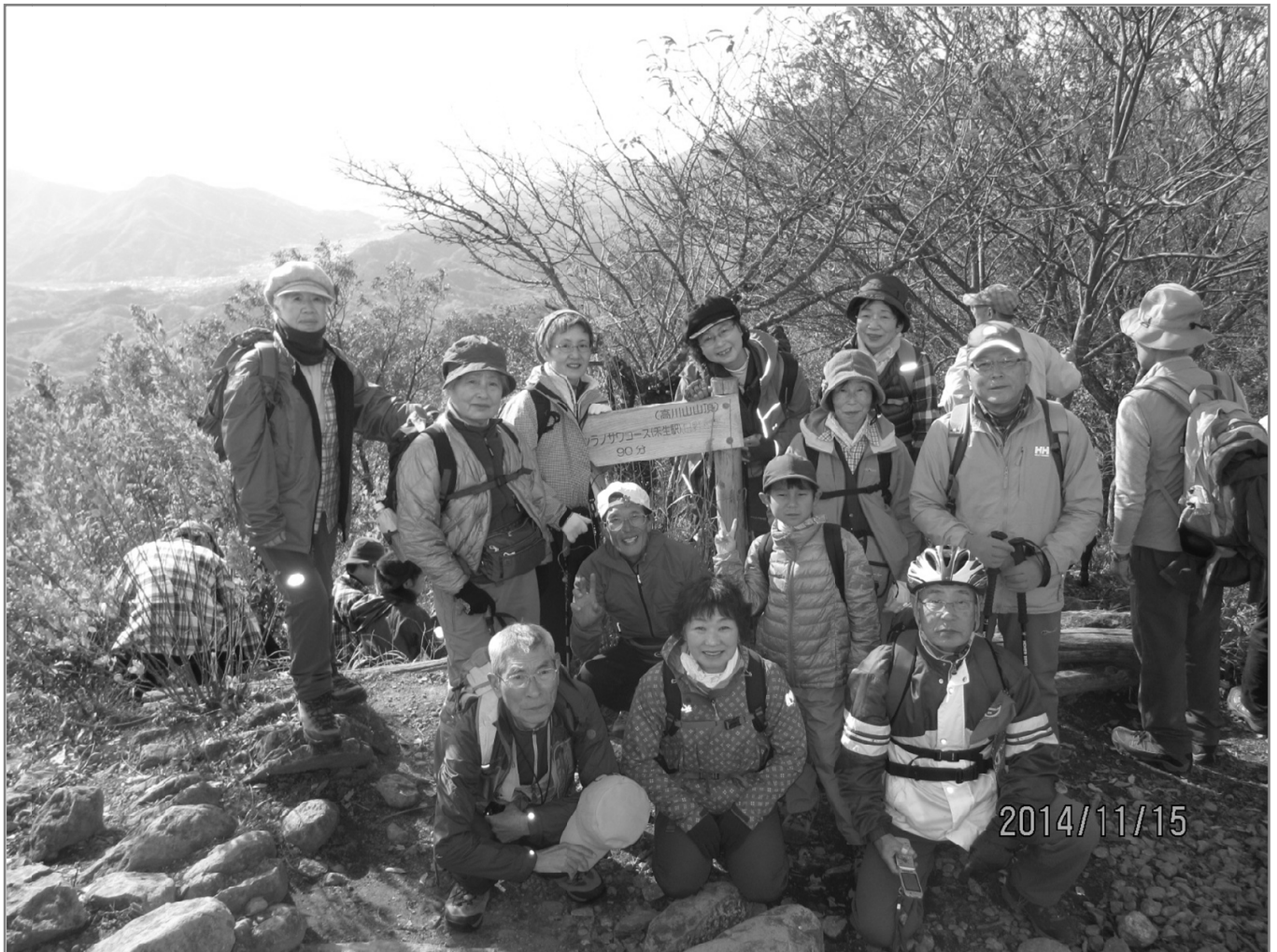
『房総を歩こう番外編』 ～山梨県・高川山～