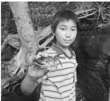
岬の主『アカテガニ』を調査！！

昨年度より主催事業で実施している「岬レンジャー」という調査事業をベースに今年度は規模・回数を拡大した活動に対して助成申請を行ったところ、セブン-イレブン記念財団より活動支援を頂けることとなりました。おかげさまで赤外線カメラや暗視スコープなど備品も購入でき、調査内容もより向上した活動となりました。