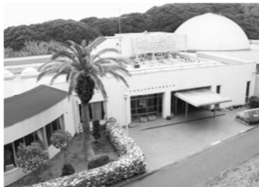
大房岬少年自然の家